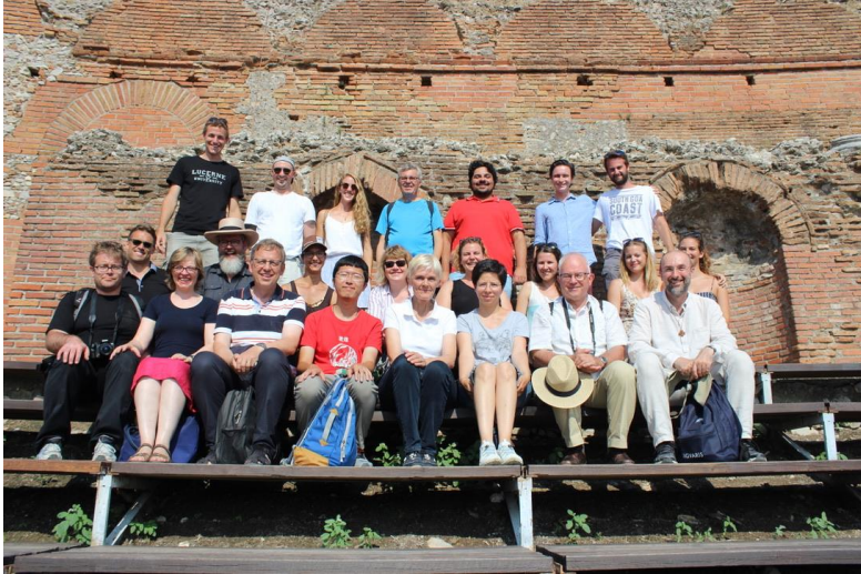
Alte Kirchengeschichte Studienreise nach Sizilien. Spezialisierungsvorlesung.