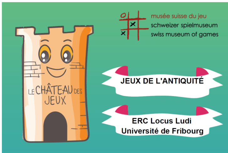
«Château des Jeux», Musée suisse du Jeu, La Tour-de-Peilz, 8.9.2019.

The Concept of Voluntary in Plotinus: Visiting Scholar of the Kyung Hee University, Seoul.