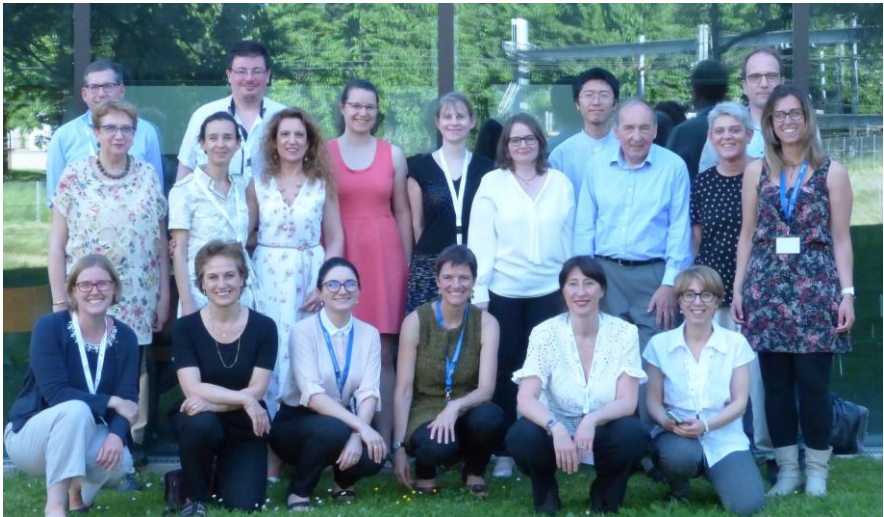
Les 18 et 19 juin, quinze spécialistes de la danse dans l'antiquité ont partagé leurs résultats de recherche dans le cadre convivial offert par l'Université de Fribourg.